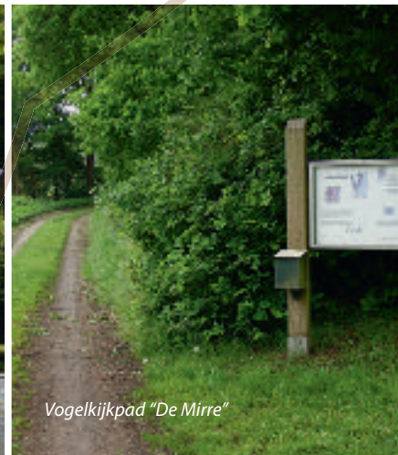
Vogelkijkpad "De Mirre"