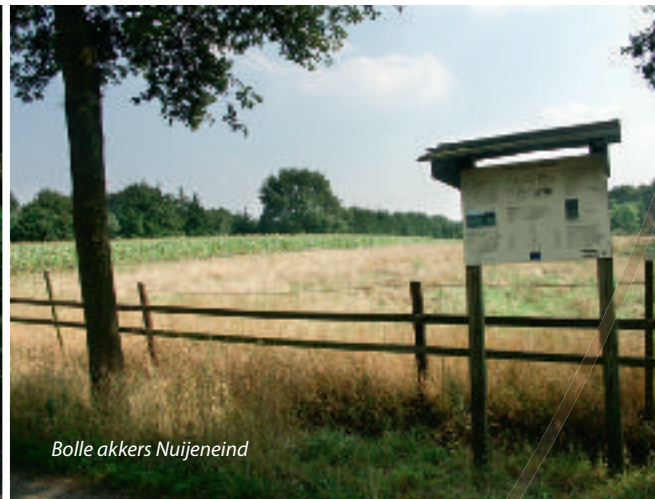
Bolle akkers Nuijeneind