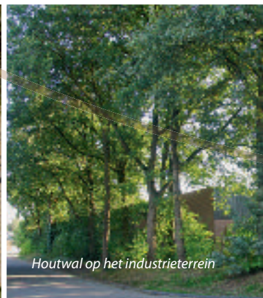
Houtwal op het industrieterrein