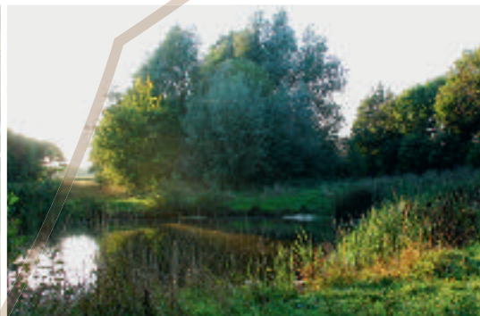
Poel bij het Wim Vloetpad