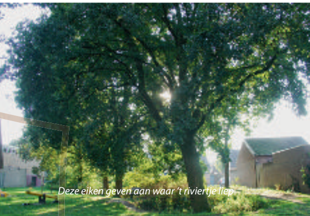
Deze eiken geven aan waar 't riviertje liep

Op het eerstvolgende kruispunt gaat u rechtsaf de weg Beekakker op. Op deze hoek staat een mooie woning uit 1932 (gemeentelijk monument). Dit was de ambtswoning van burgemeester Muysier . Direct naast deze woning liep "De Beek", zoals het riviertje algemeen bekend was. Dit verklaart ook meteen de naam van de weg Beekakker. Tot 1954 heeft er een boterfabriek gedraaid op de hoek Auerschootseweg - Molenakkers. Het water, dat gebruikt was om de kruiken te spoelen werd naar deze beek geleid. Daardoor kreeg de Beek ook wel de prozaïsche