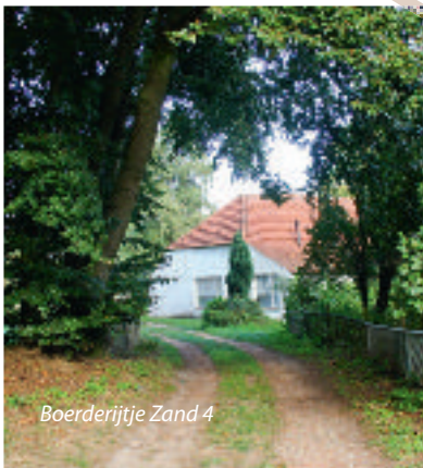
Boerderijtje Zand 4