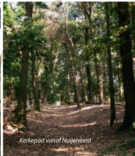
Kerkepad vanaf Nuijeneind