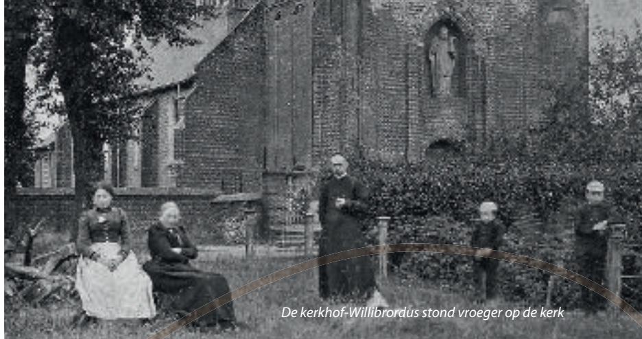
De kerkhof-Willibrordus stond vroeger op de kerk

Zo'n 10 jaar geleden zijn 4 wandelroutes uitgezet door Dorpsoverleg Bakel. Er is echter nooit een beschrijving van gemaakt. Het initiatief om dit alsnog te doen komt van de VVV van onze gemeente en past toevallig naadloos in de viering van Bakel1300, aangezien deze routes de historisch belangrijkste plekken en plekjes van Bakel aandoen.