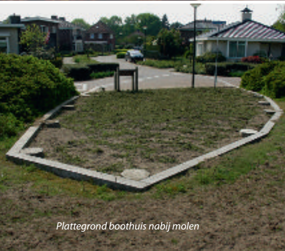
Plattegrond boothuis nabij molen