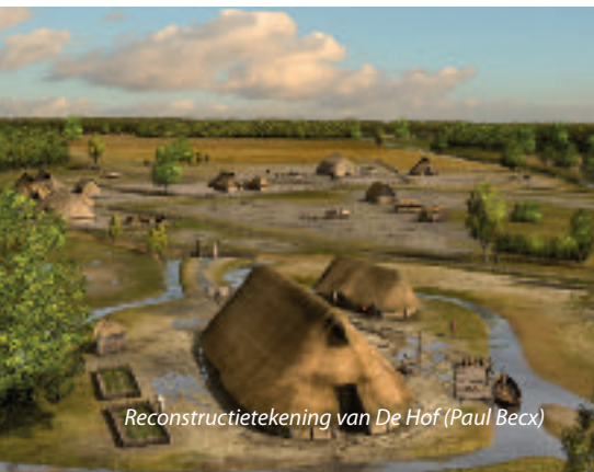
Reconstructietekening van De Hof (Paul Becx)

Tijd om even stil te staan bij de archeologische opgravingen die hier in 2008 / 2009 hebben plaats gevonden. Er zijn twee nederzettingen gevonden, een uit de late IJzertijd (ca. 800 v. Chr.) en een uit de late middeleeuwen (12e à 13e eeuw). De belangrijkste vondst is een uniek middeleeuws Hof met een gracht er omheen. Dit was opvallend groot: 35 m x 14,5 m. Ter vergelijking: