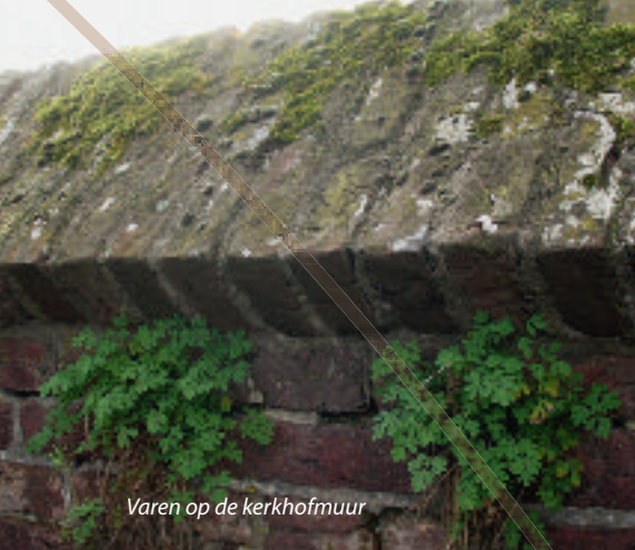
Varen op de kerkhofmuur