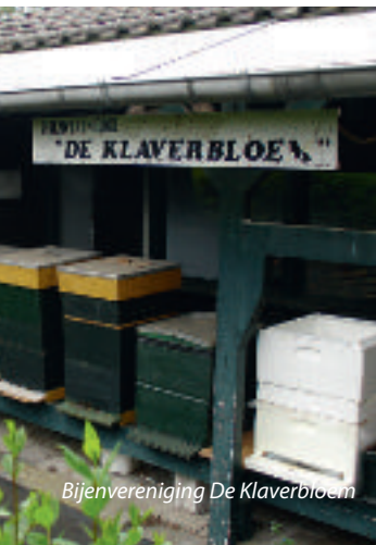
Bijenvereniging De Klaverbloem

Het pad komt weer terug op het Geneneind. Ga linksaf. Na 50 m komt u langs een prachtig gerestaureerde boerderij uit 1846. De muurankers geven echter het jaar 1758 aan. Dat is het bouwjaar van de boerderij die hier vroeger stond, op de fundering waarvan deze boerderij gebouwd is.