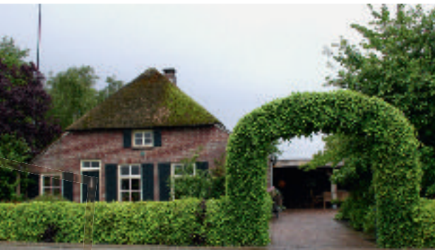
Boerderij Hilakker 2

We komen op het kruispunt met de weg Oldert . Vroeger was Den Oldert een voetpad naar Deurne. De hoofdweg naar Deurne ging toen via de Hilakker en Molenhof. Pas na 1845 werd Den Oldert voor karrenverkeer geschikt gemaakt en in 1880 werd de weg verhard. In 1953 werd de weg, die in de oorlog kapot gereden was door tanks, helemaal vervangen door een voor die tijd erg brede betonweg. Deze ligt nog steeds onder de huidige asfalt deklaag.