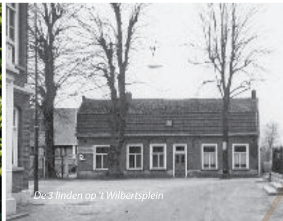
De 3 linden op 't Wilbertsplein