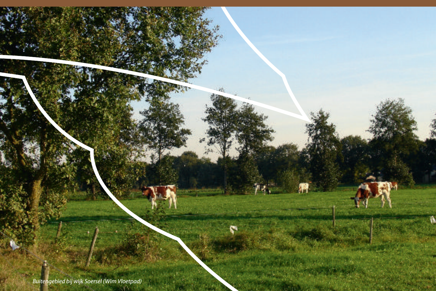
Buitengebied bij wijk Soersel (Wim Vloetpad)