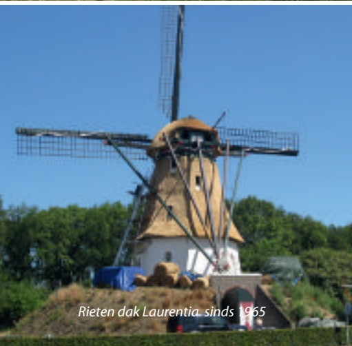
Rieten dak Laurentia, sinds 1965