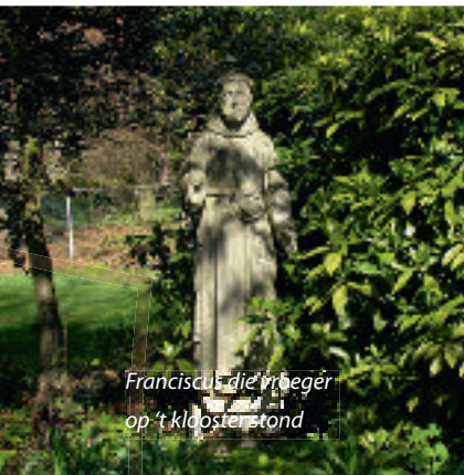
Franciscus die vroeger op 't klooster stond

Tot zover het stuk dat al in de gele route besproken is. Bij de