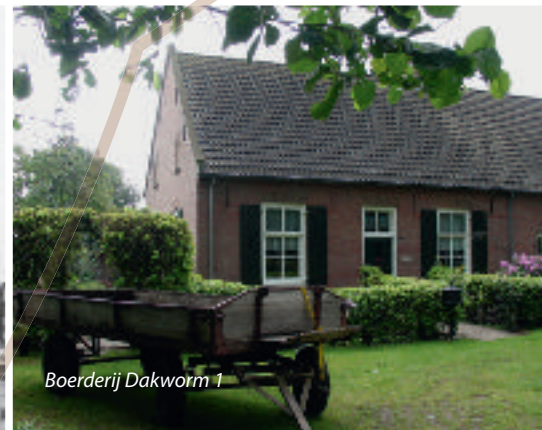
Boerderij Dakworm 1