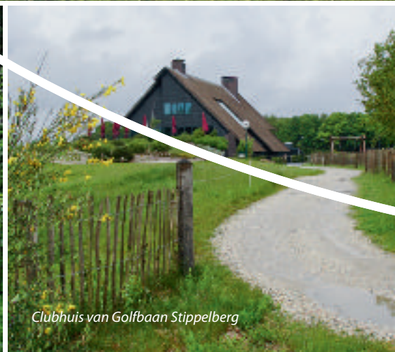
Clubhuis van Golfbaan Stippelberg