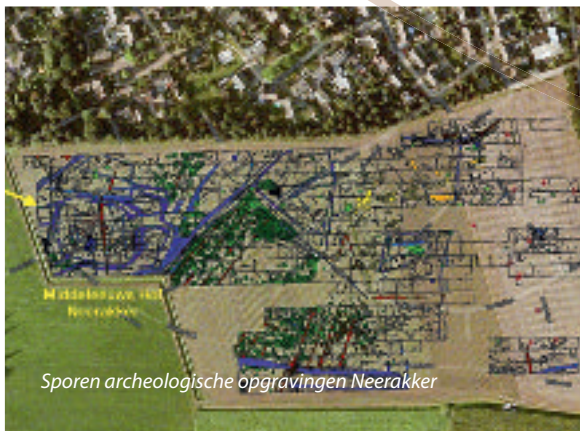
Sporen archeologische opgravingen Neerakker