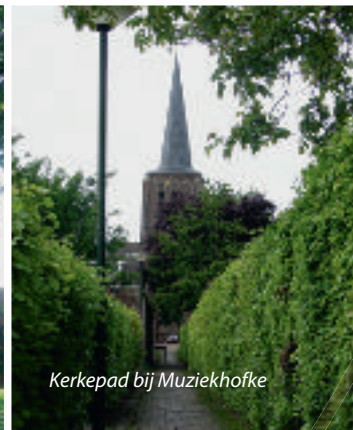
Kerkepad bij Muziekhofke