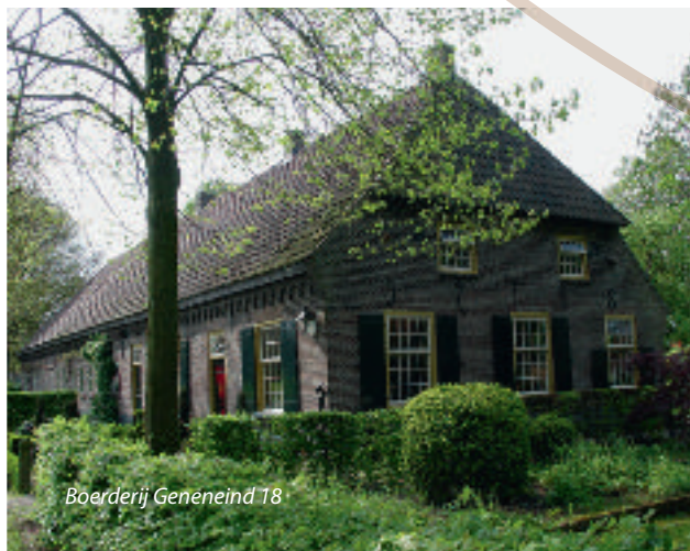
Boerderij Geneneind 18