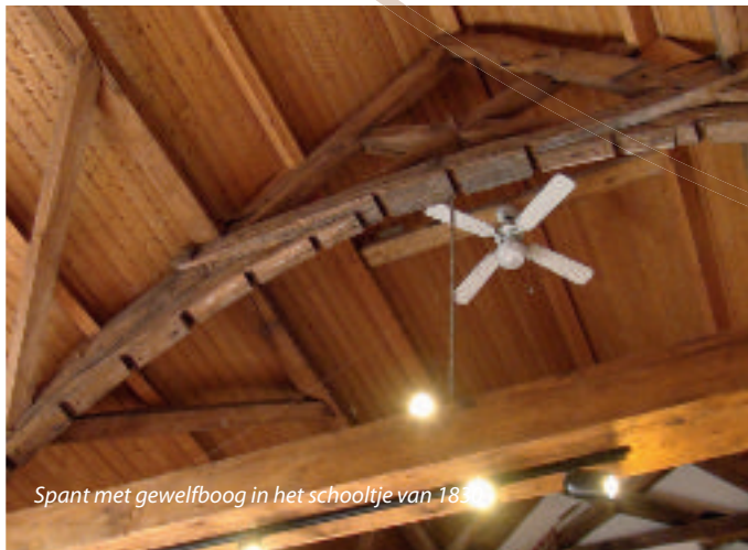
Spant met gewelfboog in het schooltje van 1830