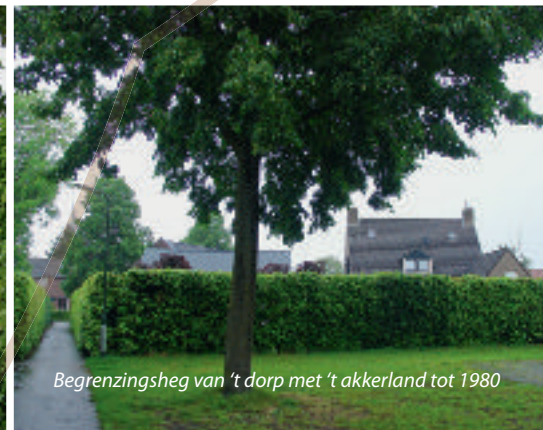
Begrenziingsheg van 't dorp met 't akkerland tot 1980