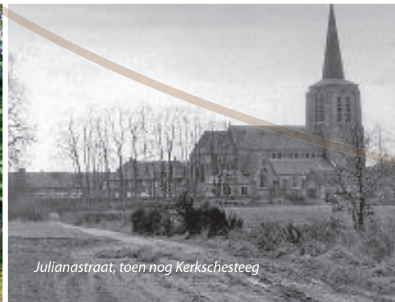
Julianastraat, toen nog Kerkschesteeeg