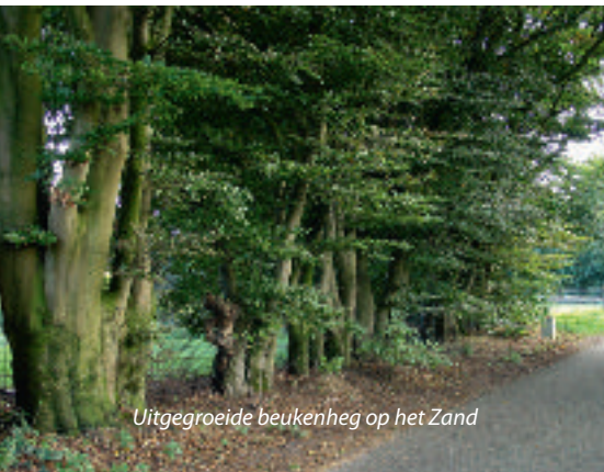
Uitgegroeide beukenheg op het Zand

Iets verderop ligt de toegangsweg naar de Jan de Witkliniek . Dit is een verpleeghuis voor mensen met een lichamelijke