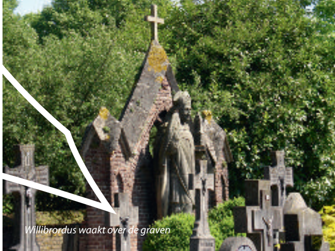
Willibrordus waakt over de graven