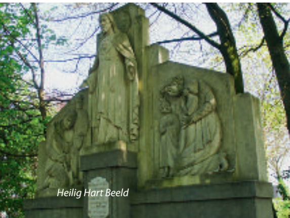
Heilig Hart Beeld

Na deze zijsprong kunt u weer terug de gele route gaan volgen, dus terug richting Parochiehuis en langs het H.Hartbeeld achter de pastoorstuin langs. Helaas heeft de pastoor in de loop der jaren steeds meer tuin in moeten leveren. U passeert een prachtige rode beuk , die vroeger gesnoeid is in een soort nestvorm. Deze maakte vroeger deel uit van deze tuin. In de tuin stond