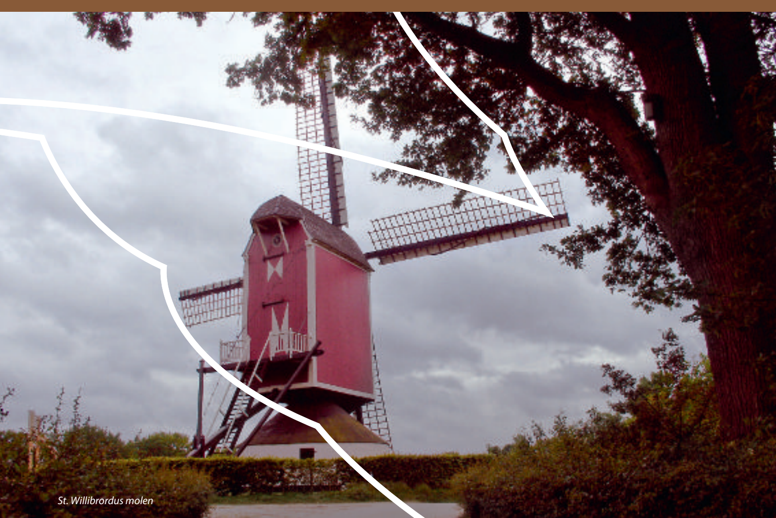
St. Willibrordus molen