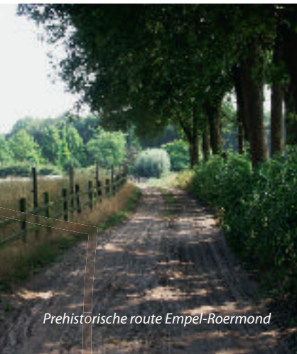
Prehistorische route Empel-Roermond

De middeleeuwse weg ging verder naar het noorden via de Neerstraat en Kivitsbraak. Ter hoogte van de Hemelsbleekweg gaat hij linksaf (eigenlijk rechtdoor) het bos in en heet daar Oude Bakelsedijk. Hij gaat verder als de Oudestraat in Gemert, hetgeen herinnert aan de naam Alde Strate, zoals de route in